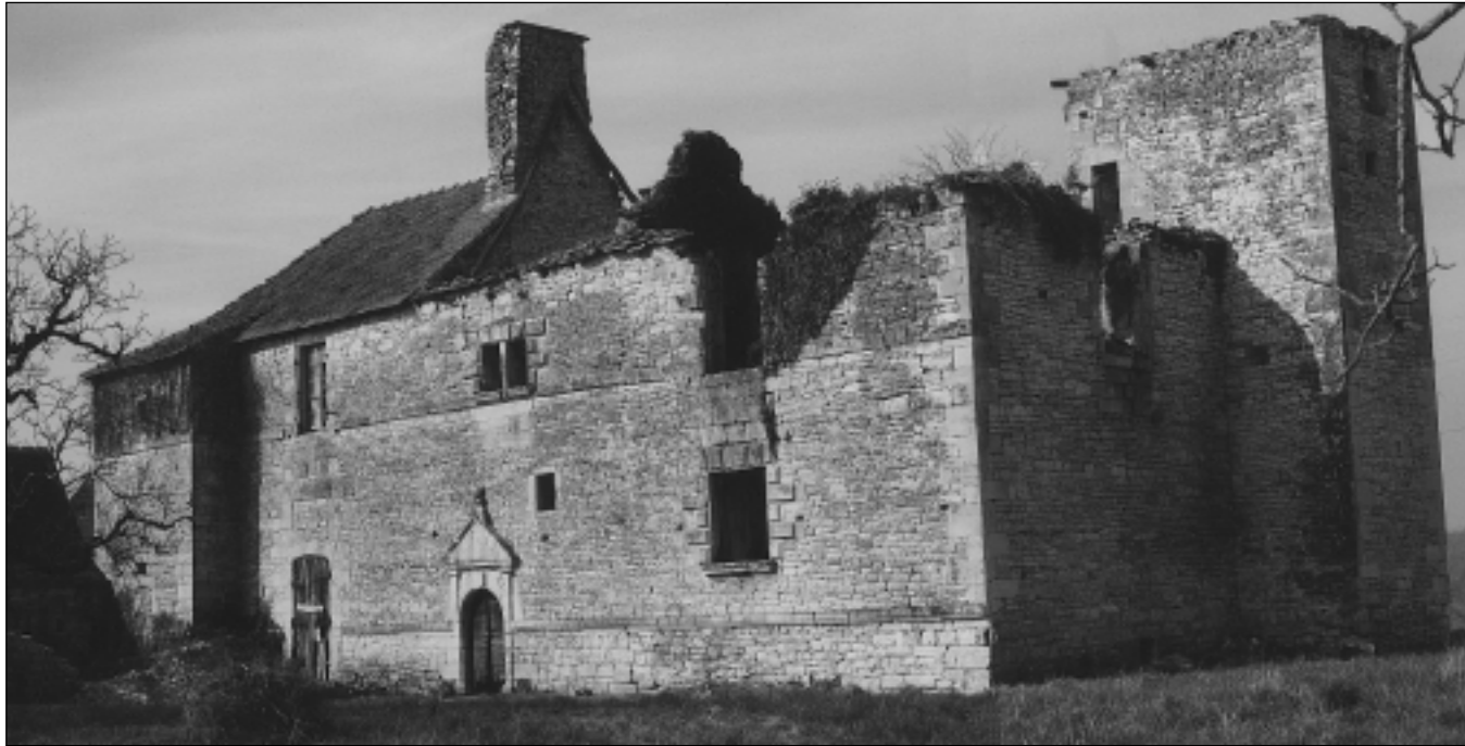
Le château de Lantis à Dégagnac. Tour et logis