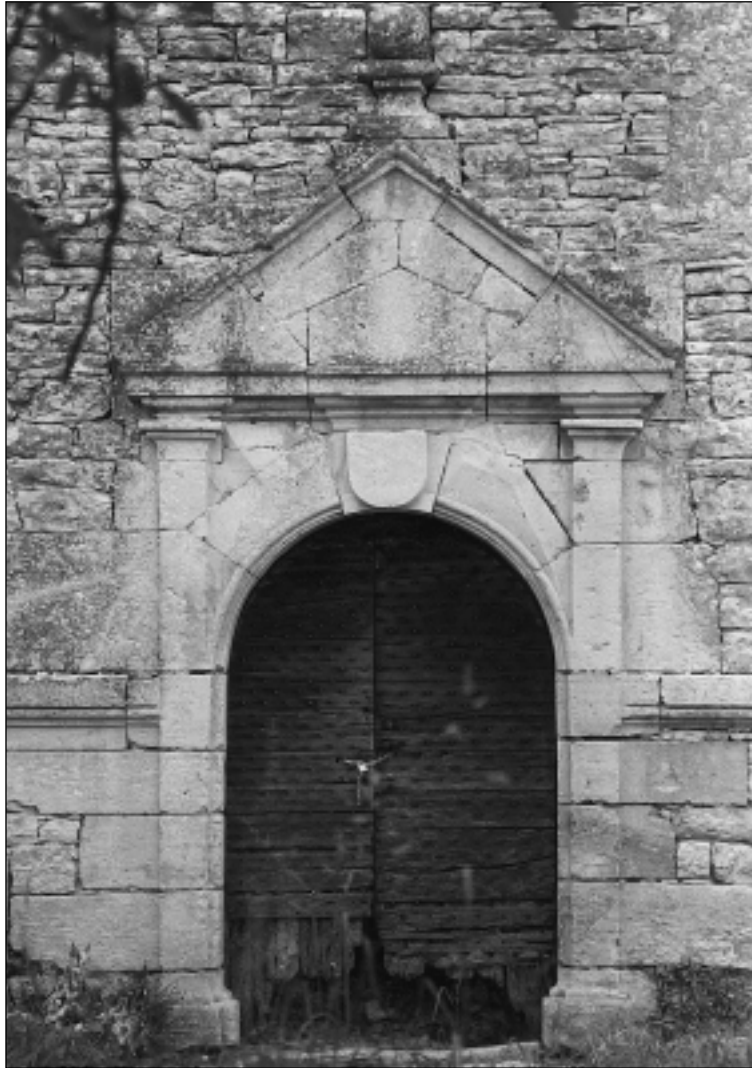
Le château de Lantis à Dégagnac. Porte d'entrée.